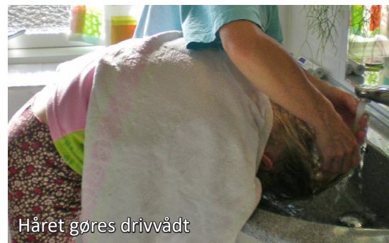
Håret gøres drivvådt