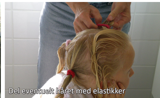
Del eventuelt håret med elastikker