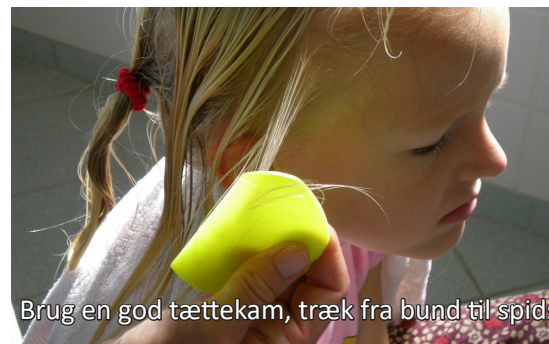
Brug en god tættekam, træk fra bund til spids